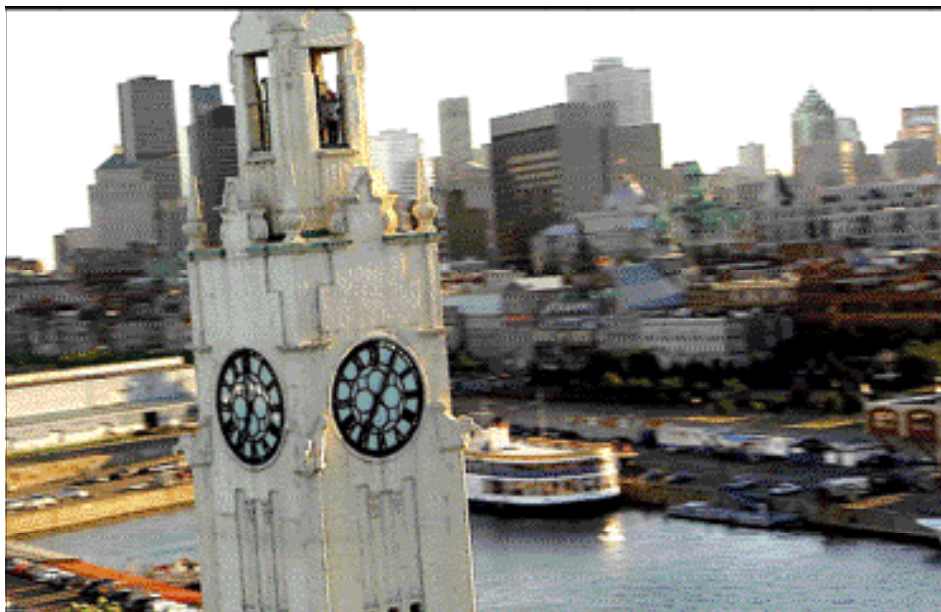
Panorama de Montréal

Le Québec a développé une culture vivante, résolument contemporaine et ouverte sur le monde, une culture au carrefour des tendances européennes et américaines. La structure sociale et l'urbanisme sont typiquement nord américains. Quant au style de vie, il résulte d'influences diverses auxquelles ont