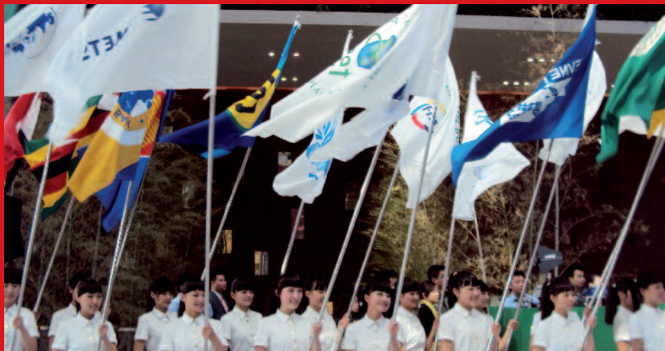
Au centre, le drapeau du FFA, lors de la journée d'inauguration de l'Exposition Universelle

« MEILLEURE VILLE, MEILLEURE VIE », TEL EST LE THÈME DE L'EXPOSITION UNIVERSELLE DE SHANGHAI QUI MET L'ACCENT SUR LE DÉVELOPPEMENT DURABLE.