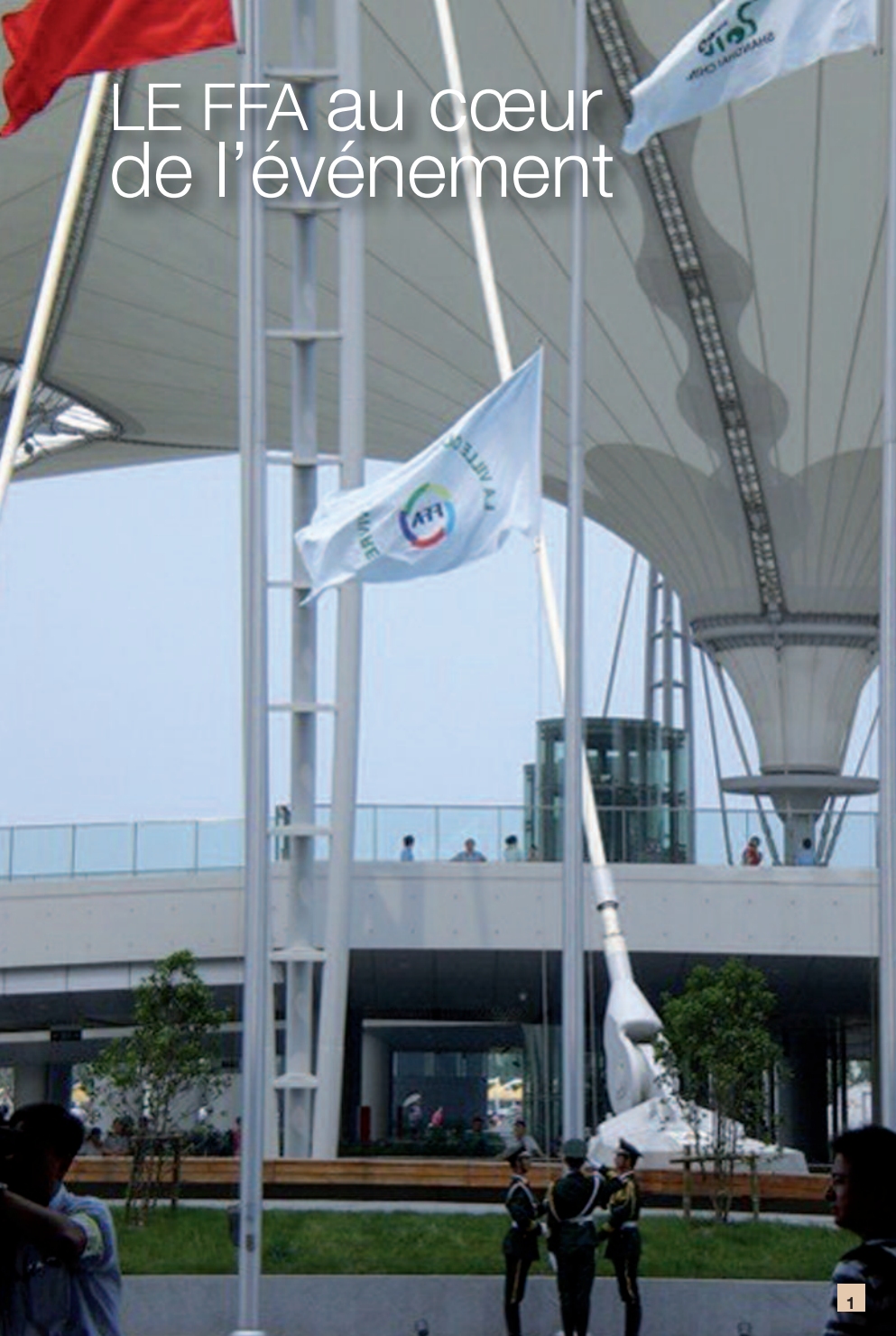
1. Drapeau du FFA représentant la francophonie internationale, hissé par les militaires, au côté du drapeau chinois