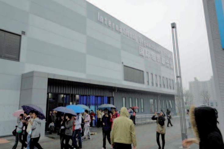
Hall des organisations internationales