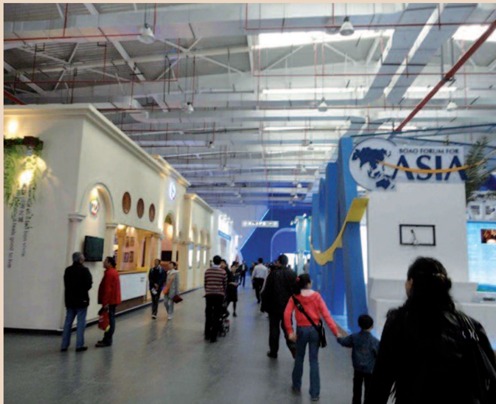
Le Pavillon du Forum Francophone des Affaires, face à celui de l'ASEAN

Situé dans le hall consacré aux organisations internationales, le Pavillon du Forum Francophone des Affaires est voisin de celui des Nations Unies, de l' ASEAN (Association des nations du sud-est asiatique) , du COMESA (Marché commun de l'Afrique orientale et australe) .