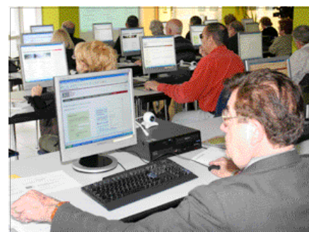
Atelier informatique pour les personnes âgées

La Fondation Crèdit Andorrà collabore également, avec d'autres institutions, à faire connaître le pays. Dans ce sens, la salle des expositions du Gouvernement