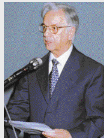
Le Président de la République du Brésil Itamar Franco intervenant aux Assises de la francophonie économique du Forum Francophone des Affaires.

Antoine Poullieute, Ambassadeur de France à Brasilia qui a présenté le Brésil sous l'angle économique aux chefs d'entreprises. De nombreuses opportunités sont ouvertes par ces nouveaux accords.